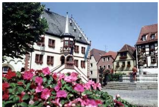
Volkach (Marktplatz mit Rathaus)